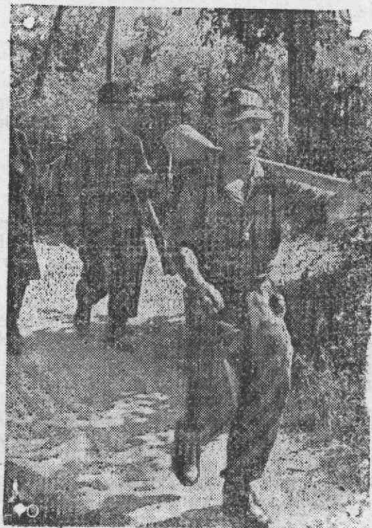
A-pesar-da superioridade em homens e material do inimigo, os granadeiros alemães avançam sempre não obstante tôdas as dificuldades.