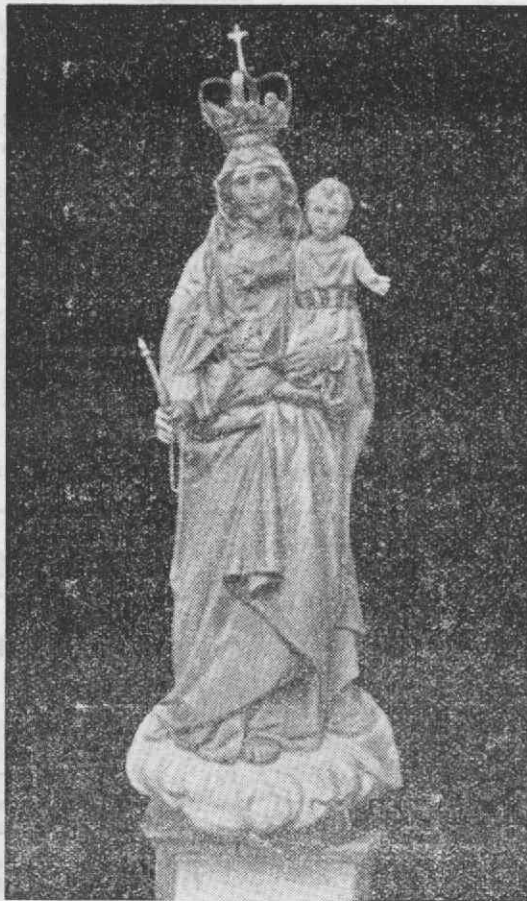
Nossa Senhora da Memória

Recordar a interessante lenda da milagrosa padroeira do Paço, Nossa Senhora da Memória, que segundo essa narrativa, que todo o povo conhece, apareceu à borda do mar e foi venerada à custa dos seus milagres, é levar a alma a reavivar a saúde das festas que lhe são dedicadas, tão caracteristicamente, todos os anos e estar-se ansioso porque outras cheguem.