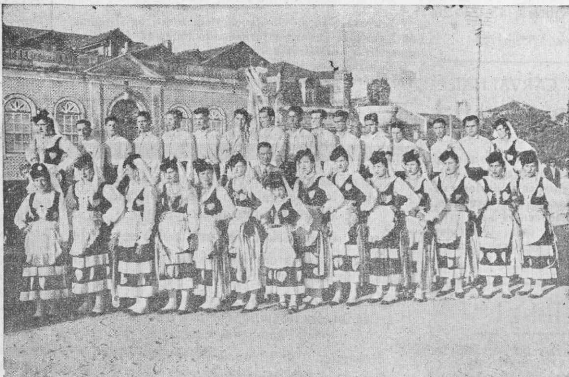
Rancho «Os Unidinhos», da Mealhada, que se exhibe na segunda-feira desta festa, conforme vai anunciado no programa

Recolhida a procissão, o juiz cessante, acompanhado dos seus mordomos e da Banda de Canelas, fará a ENTREGA DO RAMO ao juiz para 1948, cujo