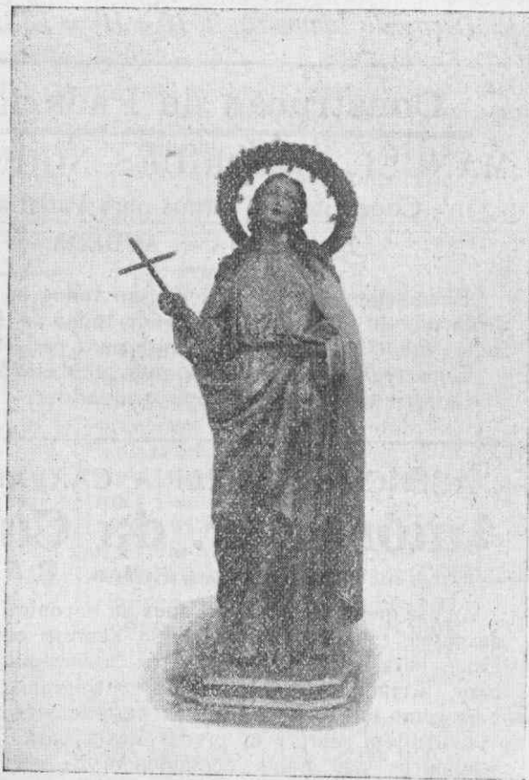
Nova imagem de Santa Maria Madalena

Recolhida a procissão, intensifica-se o movimento nas ruas, afluindo alegres grupos de forasteiros, que se espalham pelos aprazi-