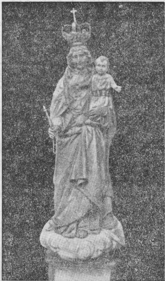
Nossa Senhora da Memória

A's 22 horas, as mesmas Bandas de Travassô e Pardilhó sobem