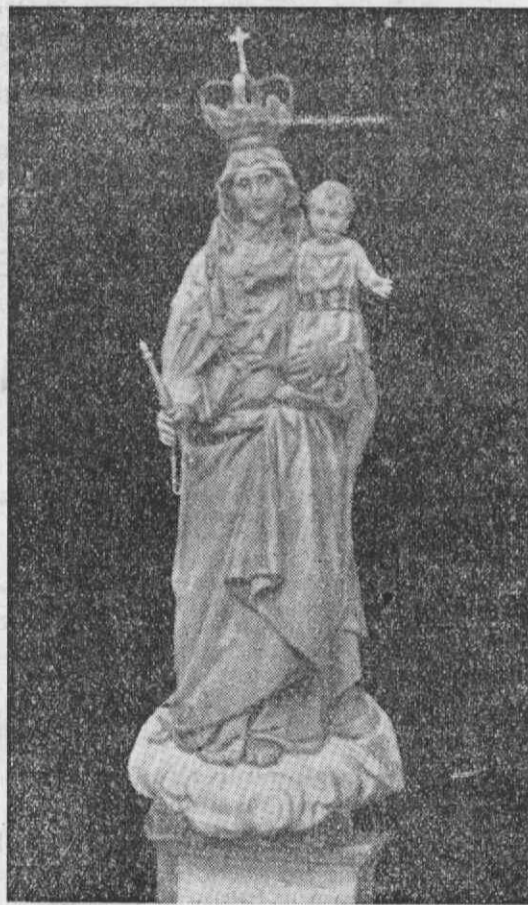
Nossa Senhora da Memória

A's 22 horas, as mesmas Bandas de Travassô e Pardilhó sobem