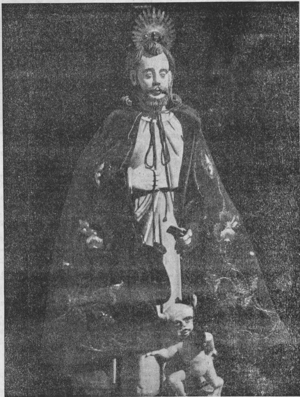
Imagem do milagroso S. Bartolomeu