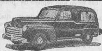
Auto-Fúnebre de Luxo com lugares

Funerais dos mais modestos aos mais luxuosos