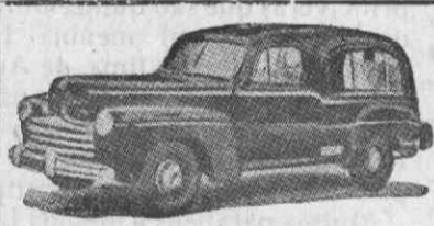
Auto-Fúnebre de Luxo com lugares

Funerais dos mais modestos aos mais luxuosos