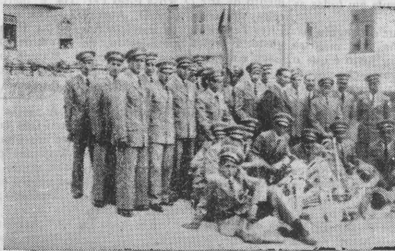
A Banda do Grupo Musical Caciense, no dia da sua inauguração

Mas quem, como nós, se não conserva orgulhoso por Cacia possuir uma Banda de Música? Tornamo-nos vaidosos, mas que importa se nos alimenta o fogo sagrado do desenvolvimento da nossa terra!?