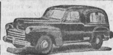
Auto-Fúnebre de Luxo com lugares

Funerais dos mais modestos aos mais luxuosos