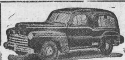
Auto-Fúnebre de Luxo com lugares

Funerais dos mais modestos aos mais luxuosos