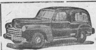
Auto-Fúnebre de Luxo com lugares

Funerais dos mais modestos aos mais luxuosos