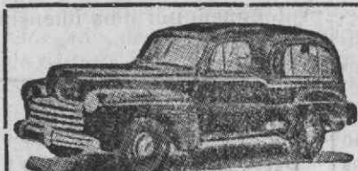
Auto-Fúnebre de Luxo com lugares

Funerais dos mais modestos aos mais luxuosos