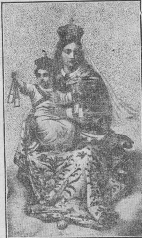
Nossa Senhora do Carmo

Às 15,30 horas, a Banda de Angeja irá com a comissão esperar a afamada BANDA VELHA