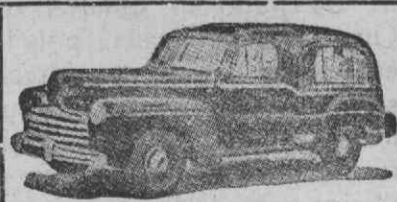
Auto-Fúnebre de Luxo com lugares

Funerais dos mais modestos aos mais luxuosos