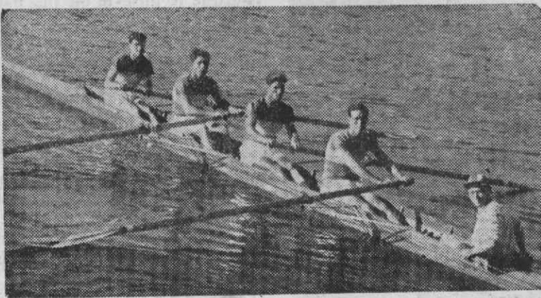
Na prova de seniores «shell» de 4 remos, os Galitos de Aveiro voltaram a evidenciar a sua já tradicional superioridade. Esta é a sua valorosa tripulação, mais uma vez campeã nacional

—Em Portugal não temos melhor e assim dá gosto ver remo. A pista é ideal e depois de tudo pronto é simplesmente maravilhoso.