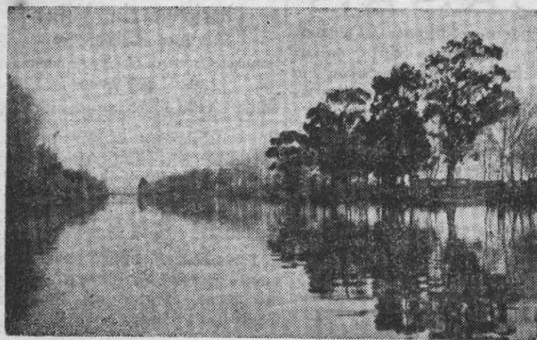
Neste cenário de maravilha do Rio Novo do Príncipe, não faltam as condições exigidas para a realização das mais importantes provas de remo

Cacia, saindo da pacatez de vila provinciana em que dormi-