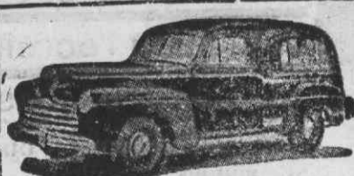
Auto-Fúnebre de Luxo com lugares

Funerais dos mais modestos aos mais luxuosos