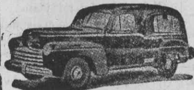
Auto-Fúnebre de Luxo com lugares

Funerais dos mais modestos aos mais luxuosos