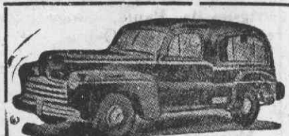
Auto-Fúnebre de Luxo com lugares

Funerais dos mais modestos aos mais luxuosos