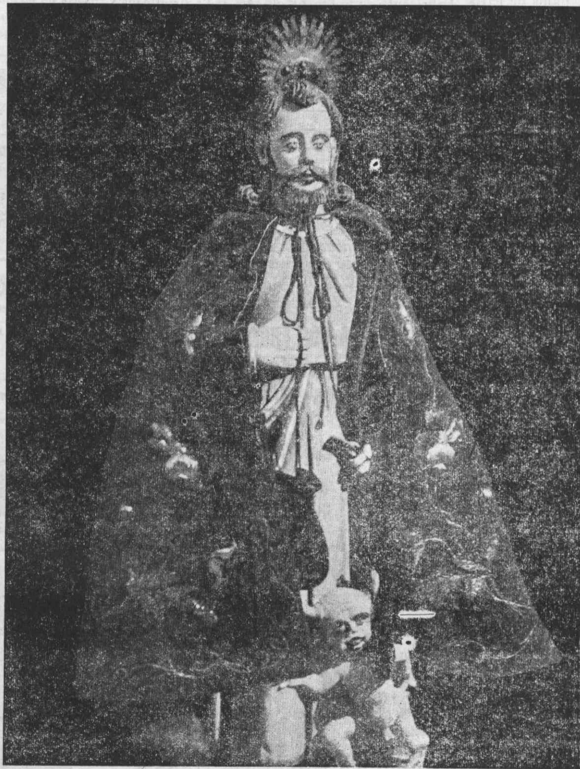
Imagem do milagroso S. Bartolomeu