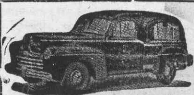
Auto-Fúnebre de Luxo com lugares

Funerais dos mais modestos aos mais luxuosos