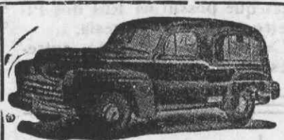
Auto-Fúnebre de Luxo com lugares

Funerais dos mais modestos aos mais luxuosos