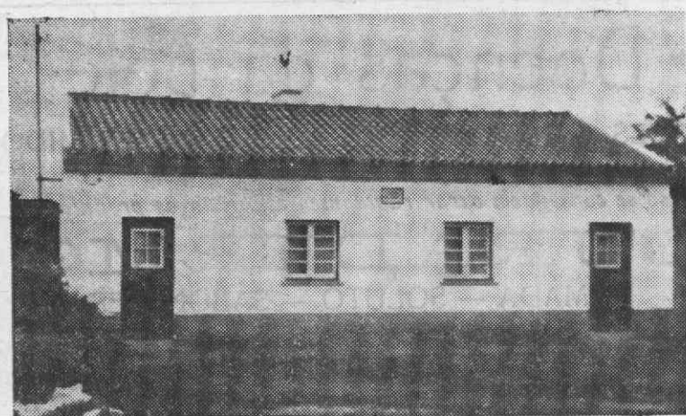
Este é o bloco das duas casas que foram entregues no dia 29 de Maio findo, numa cerimónia sem festa, conforme dissemos a semana passada em pormenorizada notícia.