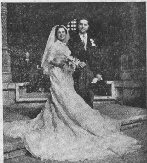
Os noivos após o acto religioso nos Jerónimos