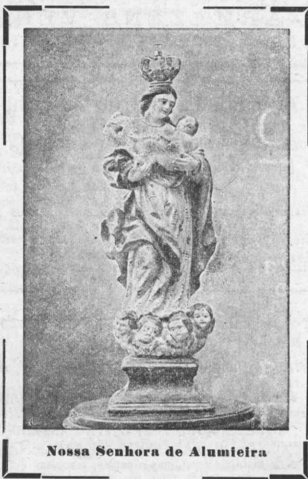
Nossa Senhora de Alumieira