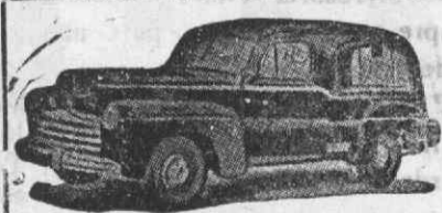
Auto-Fúnebre de Luxo com lugares

Funerais dos mais modestos aos mais luxuosos