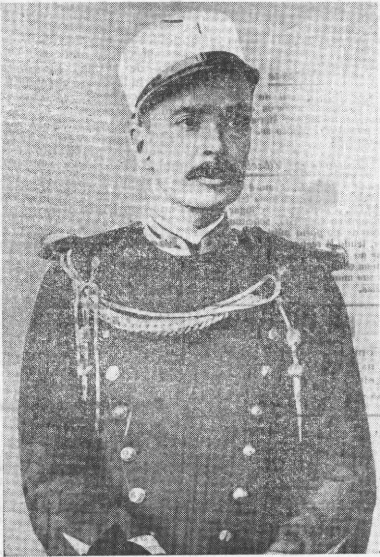
Mousinho de Albuquerque

Dentro do território cuja população reconhecia a sua autoridade suprema, cabia algumas vezes a área de Portugal. Era muito rico, só em manadas de gado possuía algumas centenas de milhares de libras; e em marfim e outros haveres, atingia uma fortuna importante, pois pagavam-lhe tributo numerosos