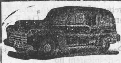
Auto-Fúnebre de Luxo com lugares

Funerais dos mais modestos aos mais luxuosos