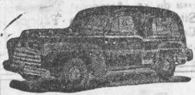
Auto-Fúnebre de Luxo com lugares

Funerais dos mais modestos aos mais luxuosos