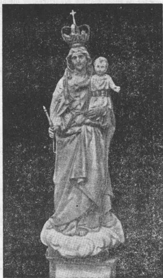
NOSSA SENHORA DA MEMORIA

RECORDAR a interessante história da milagrosa padroeira do Paço, Nossa Senhora da Memória, que segundo essa narrativa, que todo o povo conhece, apareceu à borda do mar e foi venerada à custa dos seus milagres, é levar a alma a reavivar a saudade das festas que lhe são dedicadas, tão caracteristicamente, todos os anos e estar-se ansioso por que outras cheguem. E assim, de ano para ano, a tradição aumenta conforme envelhece a aparição centenária da Virgem, a quem o nosso povo tanto amor consagra e dispõe da sua melhor boa-vontade em lhe demonstrar a gratidão pelas bênçãos que distribui. Por isso, surge mais esta festa em que todos vamos colaborar e manifestar toda a fé que enche completamente os nossos corações de veras agradecidos e orgulhosos por sentirem a verdade do prodígio sobrenatural.