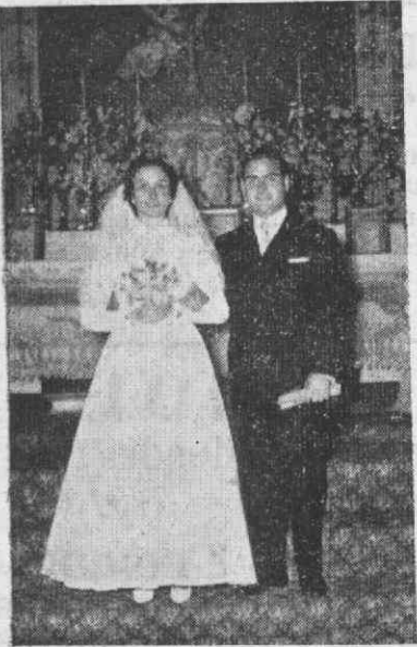
Os noivos depois do enlace