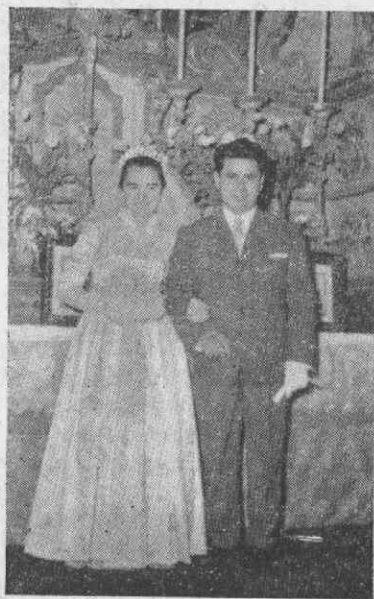
Os noivos após o acto religioso