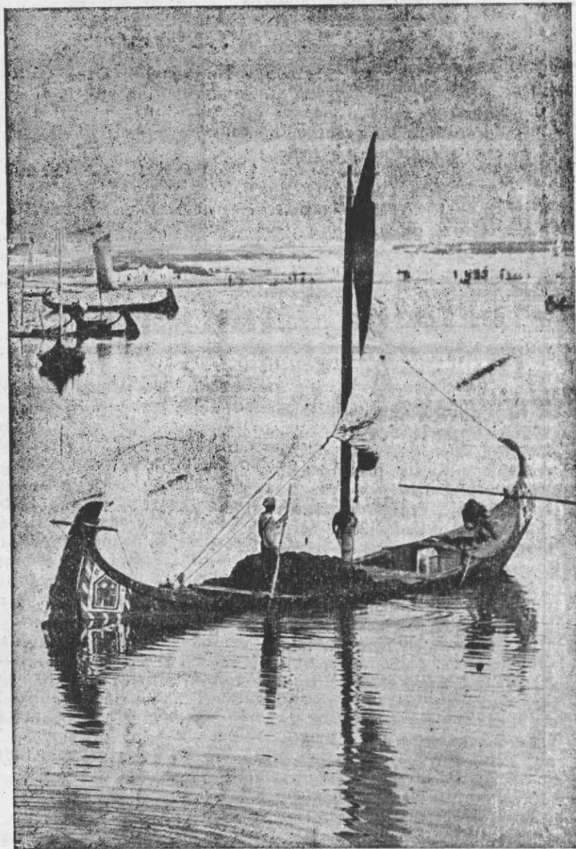
Barcos na Ria

Gravura gentilmente cedida pela Câmara Municipal de Aveiro