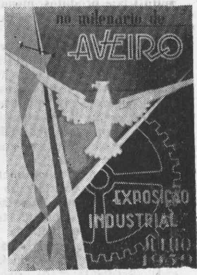
O cartaz anunciador da Exposição

principal) em que se divide toda a área da Exposição. O eixo Nascente-Poente será definido pela área central de árvores, tendo como primeiro pano de fundo a estátua a erigir ao navegador João Afonso de Aveiro e como segundo plano o grande pavilhão de «Stands». O eixo Norte-Sul, será definido pela alameda principal da Exposição, ladeada pelos pavilhões mais imponentes, terminando esta sobre o Canal Central onde se situará o Restaurante-esplanada-café, o que caracterizará esta alameda como possível passeio do público. Destes dois eixos irradiarão as restantes artérias que dividirão os quatro sectores do certame e assegurarão o acesso a todos os pavilhões. Foi também considerada uma artéria que envolverá perifericamente toda a área da Exposição.