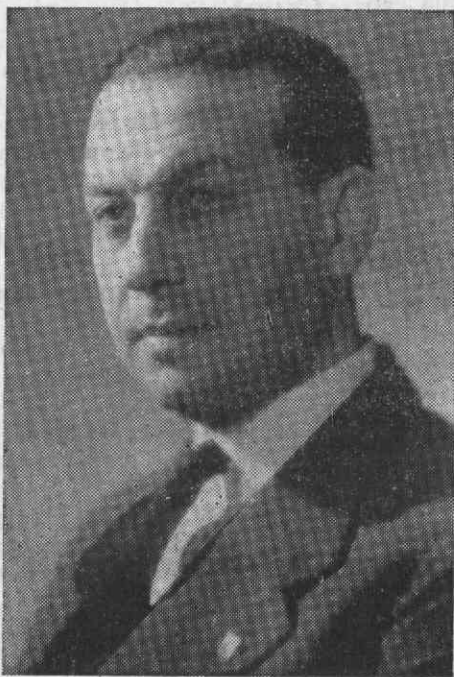
Dr. Pedro Theotónio Pereira