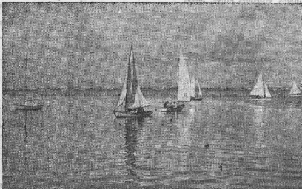
As embarcações de recreio estarão presentes em grande número na Festa da Ria