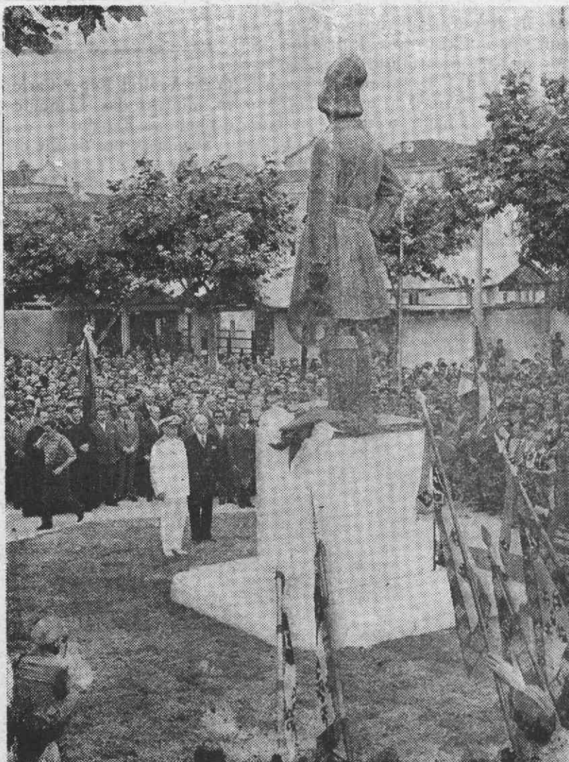
O Senhor Contra-Almirante Américo Tomás, descerra o monumento de João Afonso de Aveiro