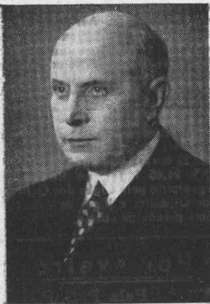
Contra-Almirante Américo Deus Rodrigues Tomás Ilustre Presidente da República