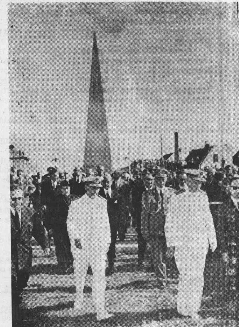
Após a inauguração do obelisco comemorativo da inauguração das obras exteriores do porto de Aveiro, o Senhor Presidente da República retira-se acompanhado pelo Senhor Ministro da Marinha

Durante a sua estadia em Aveiro, acompanhado de sua