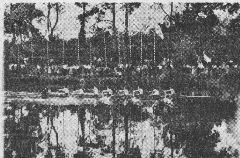
O «Shell 8» do Náutico de Viana a caminho da meta