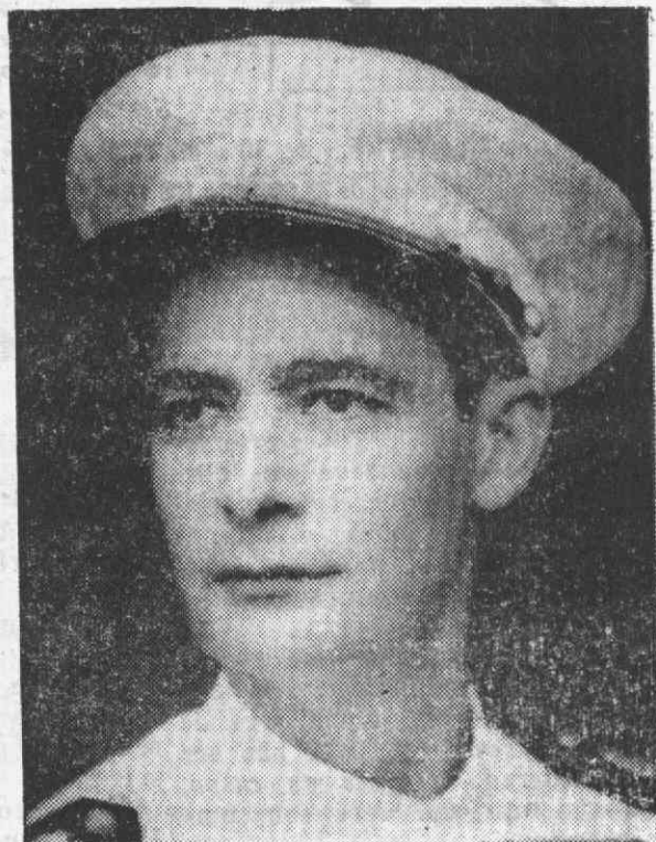
O novo Governador de Macau, major Jaime Silvério Marques

O Sr. major Jaime Silvério Marques — acrescentou o ilustre titular da pasta do Ultramar — vai encontrar dedicações, mas terá de enfrentar igualmente dificuldades, estas de ordem económica e de ordem política. As primeiras derivam do nosso próprio anseio de produzir sempre mais e melhor, e têm-las vencido em toda a medida das nossas possibilidades; as segundas encontrá-las-á, essencialmente, por influências exteriores, não crendo que factores internos as avolumem. Se há terras no mundo em que os povos se sentem verdadeiramente unidos, as nossas províncias ultramarinas constituem exemplo disso. E' assim coesa e harmoniosa a sua vida interna, mas o mesmo não poderá dizer-se em relação a influências do exterior. Por um lado, temos de contar com incompreensão e certo desconhecimento do Mundo, e por outro, com interesses opostos aos nossos e que tenazmente se nos impõe neutralizar. O novo governador vai, portanto, enfrentar dificuldades, tal como deparará com facilidades.