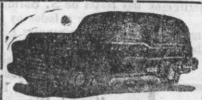
Auto-Fúnebre de Luxo com lugares

Funerais dos mais modestos nos mais luxuosos