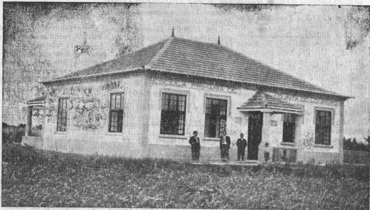
O magnífico edificio da Escola Primária da Quintã do Loureiro

O determinismo é um sistema filosófico que não admite a influência pessoal sobre a determinação, atribuindo-a inteiramente à força dos motivos; doutrina que explica os fenómenos somente pelo principio da causalidade.