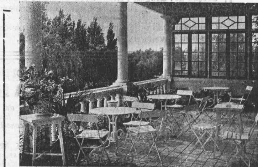
A galeria do Salão de Chá do Parque de Aveiro, empresta ao local um maravilhoso aspecto