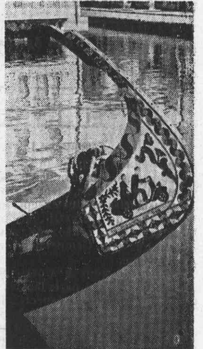
Curioso aspecto, inspirado na vida dos nossos dias, pintado na proa do «cisne da Ria» — o característico moliceiro de Aveiro.