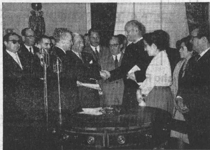
Cerimónia da entrega do alvará, no Gabinete do Ministro das Corporações, do novo Grémio da Imprensa Regional.

Por isso mesmo a escolha do «Navegador» para patrono da 32.ª Semana do Ultramar