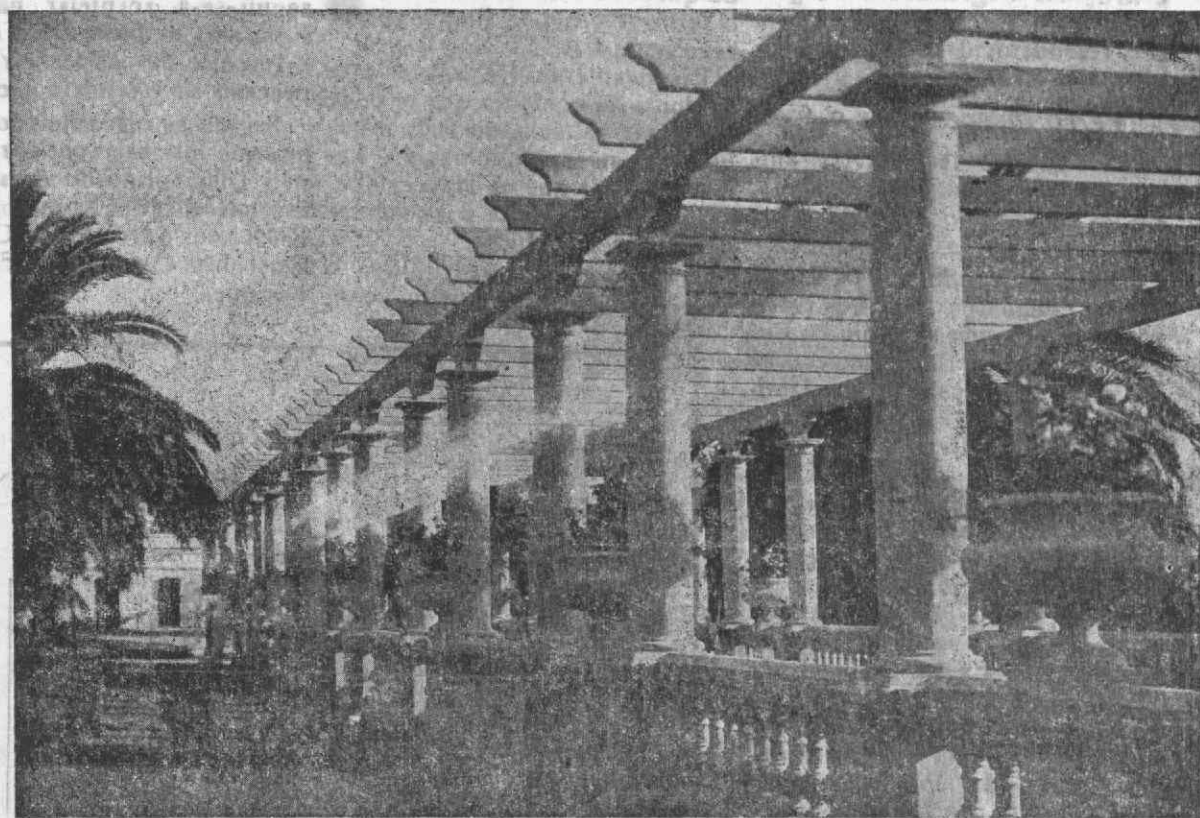
A Pergola do Jardim de Aveiro

O Parque da nossa cidade está sendo muito visitado por excursões e digressistas.