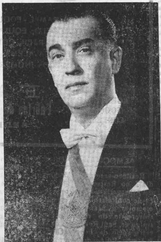
Dr. Juscelino Kubitschek de Oliveira Presidente da República dos Estados Unidos do Brasil

Remadores e directores, toda essa parada de desportistas, mostrou-se encantada com a serenidade das águas da pista de Cacia, que consideram uma das melhores que conhecem, quer na América do Norte, quer mesmo na