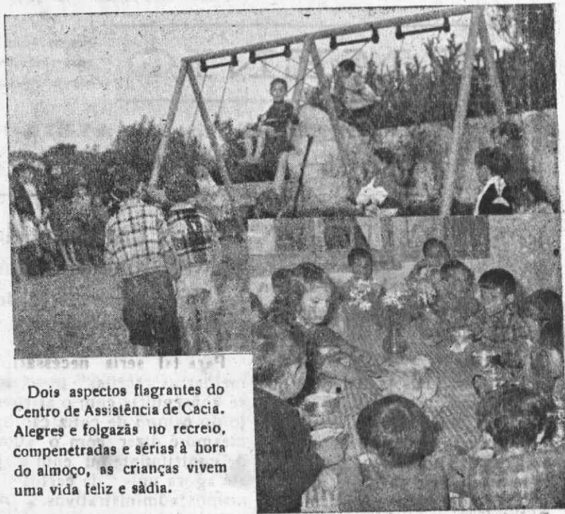
Dois aspectos flagrantes do Centro de Assistência de Cacia. Alegres e folgazãs no recreio, compenetradas e sérias à hora do almoço, as crianças vivem uma vida feliz e sãdia.