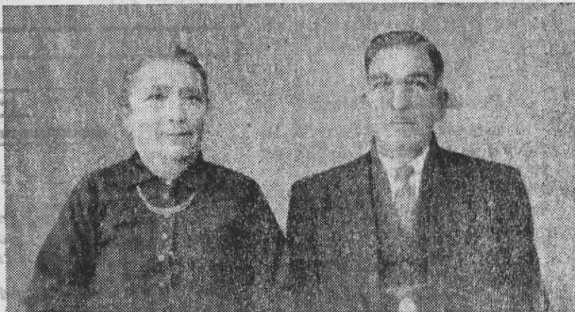
Os pais do nosso Director