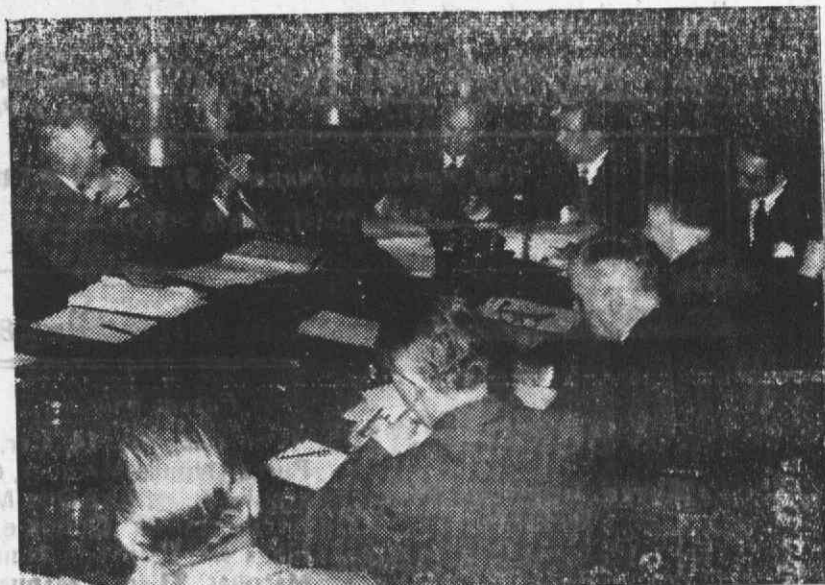
Com a presença de delegados de dez países, entre os quais Portugal, realizou-se há dias, na sede da Ordem dos Advogados, a reunião do «Bureau» da União Internacional dos Advogados.

As nossas emissoras de maiores responsabilidades dão, abundantes vezes, programas de música ligeira, organizados com trechos famosos do nosso cancionero e ainda com outros que constituem revelações de