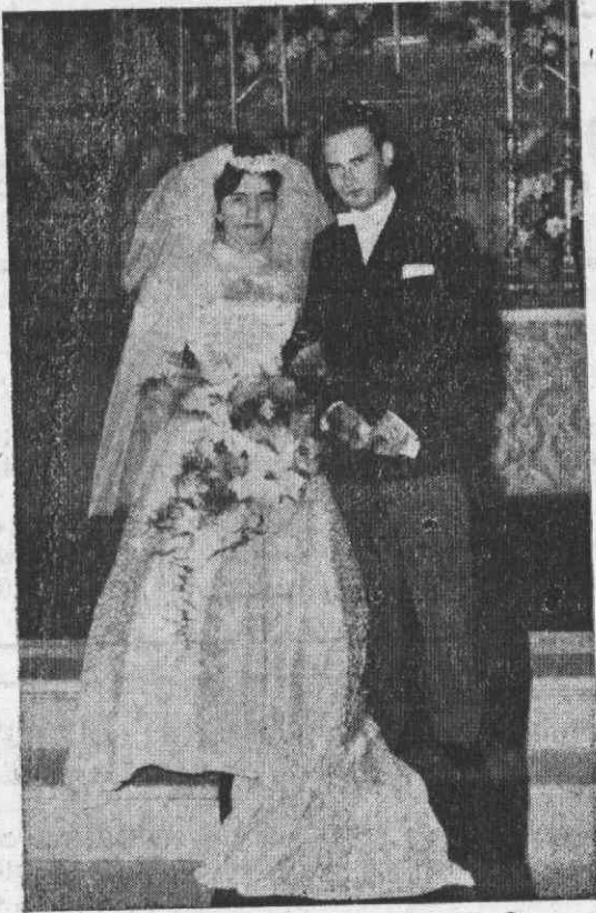
Os noivos após a cerimónia religiosa

Ao novo casal desejamos um futuro perene das maiores felicidades.