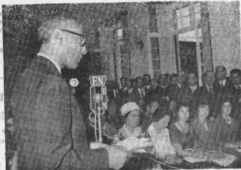
O novo presidente da Câmara Municipal de Aveiro proferindo o seu discurso

Venha a Cacia sempre que puder, dizer-nos «a palavra mais elegante, mais formosa, mais bela», porque os filhos desta «avózinha de Aveiro» são seus amigos, sincera e verdadeiramente seus amigos, mesmo que no peito dalguns homens se albergue às vezes sentimentos mesquinhos de ingratidão.